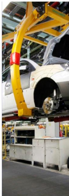
Automatización de procesos