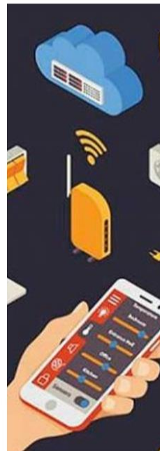
Internet de las cosas